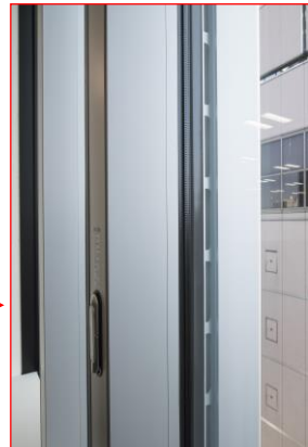
【自然換気スリット】