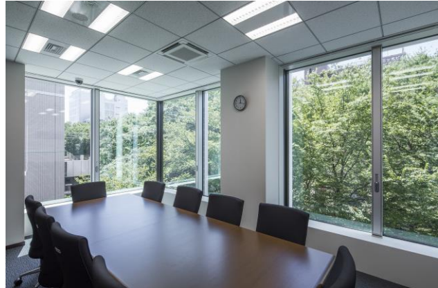
【貸室内からの眺め】

当社は、入居者の安心・安全にも積極的に取り組んでおります。構造面では、制振構造を採用し建築基準法の1.25倍以上の耐震性能を有し、大地震時の安全性を確保しています。