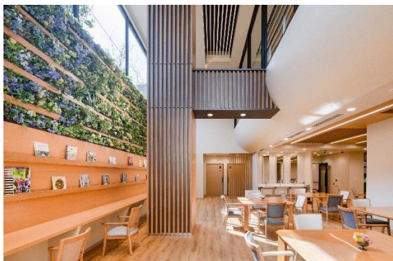
【食堂兼機能訓練室 1】

全館LED照明作用、食堂兼機能訓練室に輻射冷暖房、太陽光発電による共用部への電力供給、積極的な自然採光確保、屋上緑化など省エネルギー、省CO2に取り組んでいます。また、災害対策としても、建築基準法で定められた基準の1.25倍以上の耐震性能、非常用の電源装置を備え、安心・安全に配慮した計画としています。