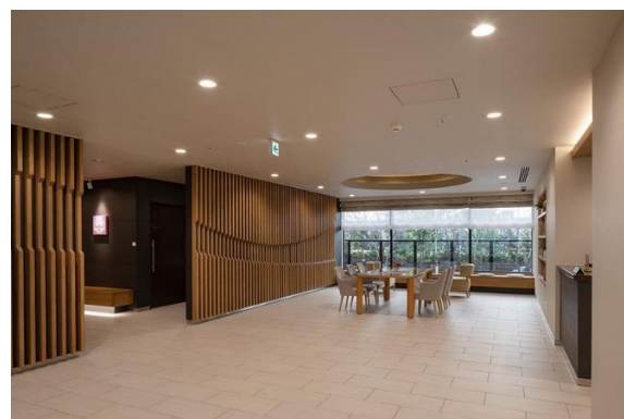
【エントランスホール2】