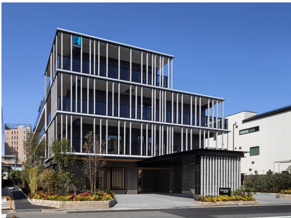
【ホスピタルメント四谷大京町】

当建物は、東京メトロ丸の内線「四谷三丁目」駅から徒歩7分に位置し、緑豊かな新宿御苑も近く、閑静な住宅地に建つ有料老人ホームです。全61室、65床の介護付き老人ホームとして、(株)桜十字に一括賃貸致します。