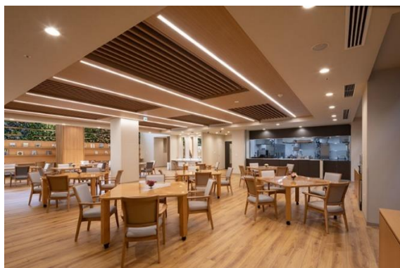
【食堂兼機能訓練室 2】