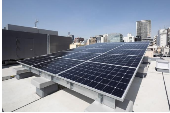
【屋上太陽光発電パネル】